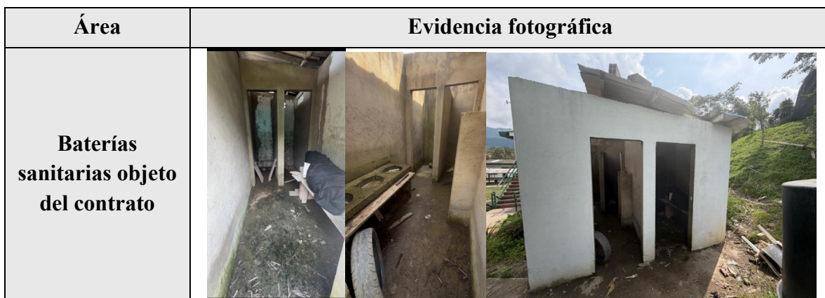
Tabla 2. Evidencia fotográfica de la inspección judicial 16

informar la fecha estimada para su entrega; (ii) ¿Cuál es el estado actual de ejecución del contrato de obra No 380-1908-2023? Para responder a este interrogante, deberán presentar un informe detallado sobre el desarrollo de su ejecución desde la suscripción del contrato hasta la fecha; (iii) ¿Cuáles han sido las acciones desarrolladas por la entidad desde la demolición de los baños para garantizar el acceso de los estudiantes del Colegio El Hortigal a servicios sanitarios en condiciones dignas? ¿Cuentan con alguna asignación presupuestal para hacer frente a esta situación?”.